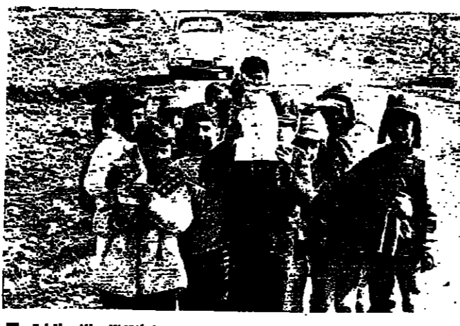
اطفال من قرية «البيستان» يحملون شظايا القاذف الإسرائيلية